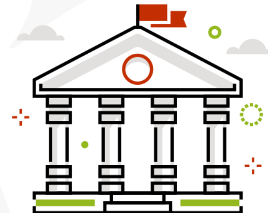
Ład korporacyjny ( Governance )