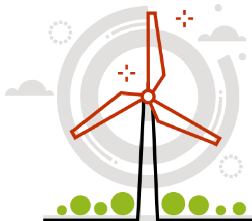
Środowisko ( Environmental )

ESG to skrót oznaczający czynniki, w oparciu o które tworzone są ratingi i oceny pozafinansowe przedsiębiorstw, państw i innych organizacji. Składają się one z 3 elementów: