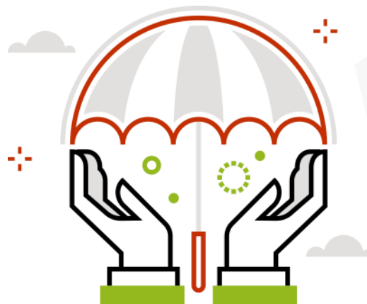
Spółeczna odpowiedzialność ( Social )