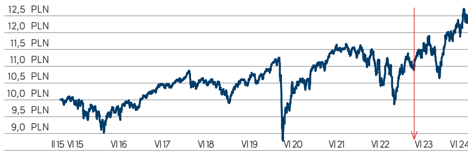
23.03.2023 r. nastąpiła istotna zmiana polityki inwestycyjnej subfunduszu.

Zmiana wartości j.u. (od pierwszej wyceny, tj. od 11.02.2015 r. do 28.06.2024 r.)