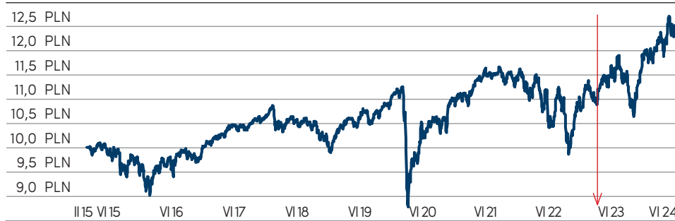
23.03.2023 r. nastąpiła istotna zmiana polityki inwestycyjnej subfunduszu.

Zmiana wartości j.u. (od pierwszej wyceny, tj. od 11.02.2015 r. do 28.06.2024 r.)