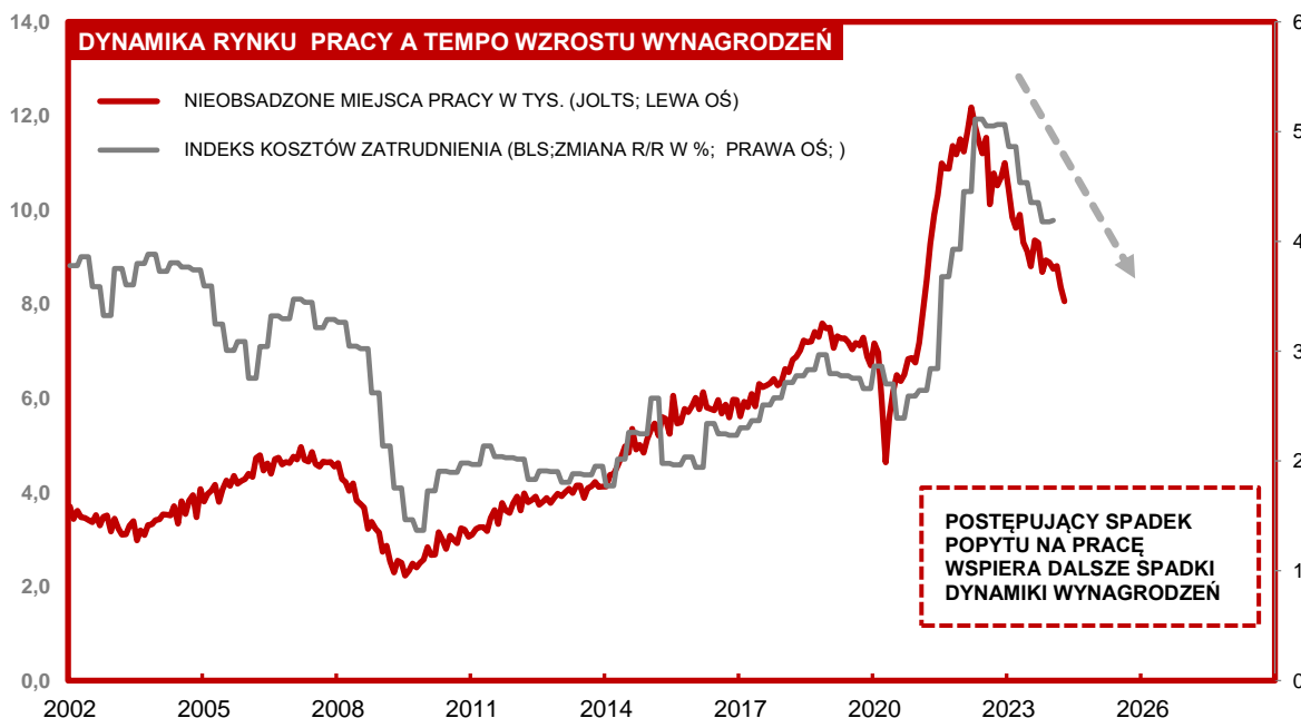
Wykres 1. Trend dynamiki wynagrodzeń w Stanach Zjednoczonych