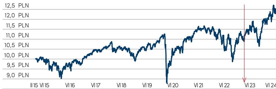
23.03.2023 r. nastąpiła istotna zmiana polityki inwestycyjnej subfunduszu.

Zmiana wartości j.u. (od pierwszej wyceny, tj. od 11.02.2015 r. do 28.06.2024 r.)