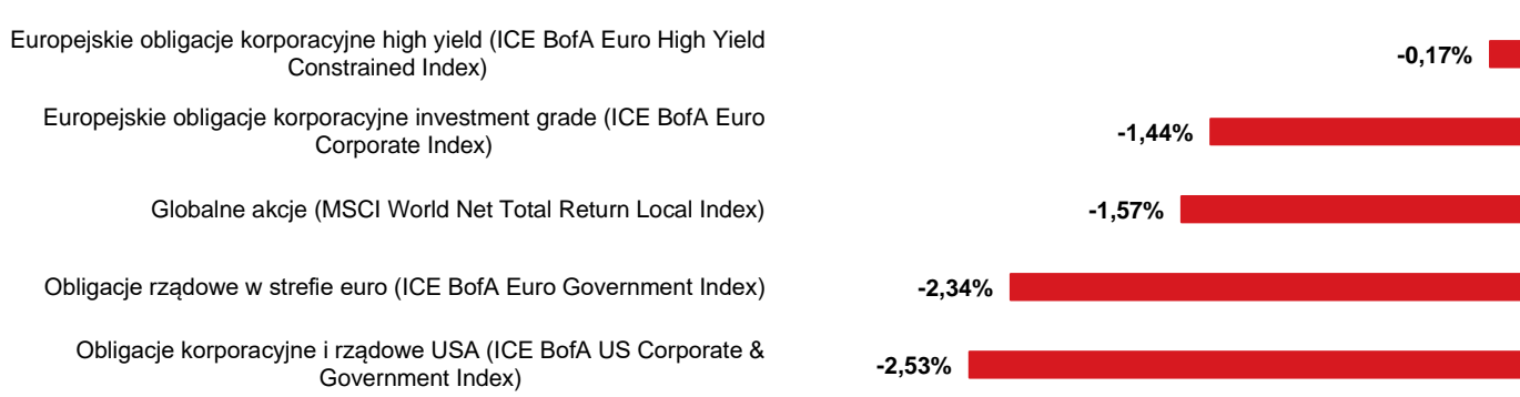
Wykres 2. Stopy zwrotu z wybranych indeksów akcji i obligacji w lutym 2023 r.