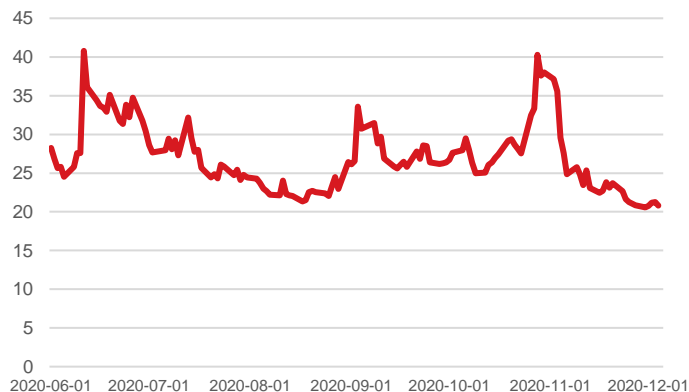
Indeks zmienności VIX (pkt)