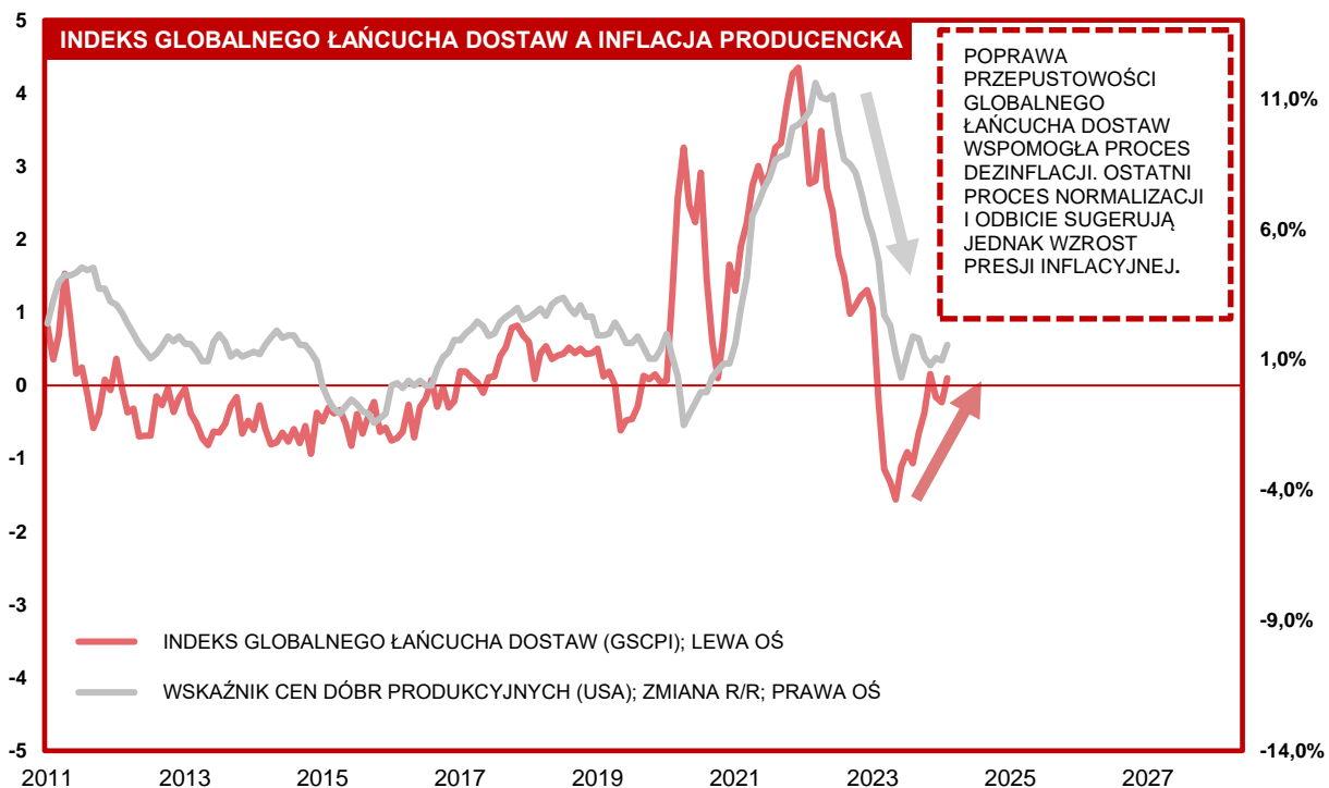
Wykres 1. Wpływ globalnej poprawy po stronie podaży na presję inflacyjną w Stanach Zjednoczonych